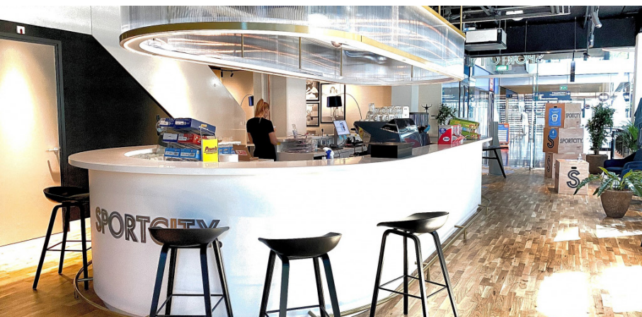
Winkel en retail