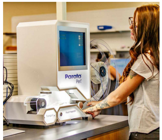
Gezondheidszorg en laboratoria