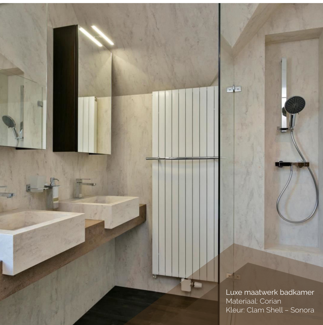
Luxe maatwerk badkamer Materiaal: Corian Kleur: Clam Shell – Sonora