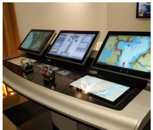
Scheepsbouw en jachten