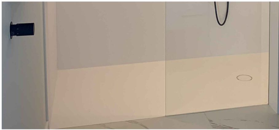
Afbeelding ter illustratie: