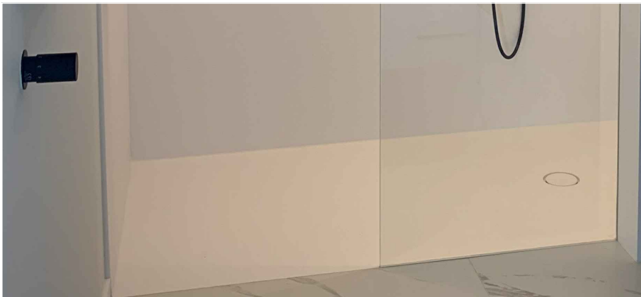
Afbeelding ter illustratie: